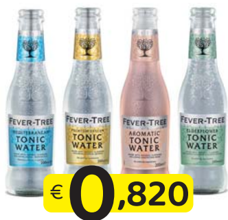
FEVER-TREE GUSTI VARI 20 CI. VAP