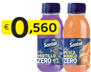
SANTAL SUCCHI ZERO ZUCCHERI PESCA E MANGO/MIRTILLO 250 ML.