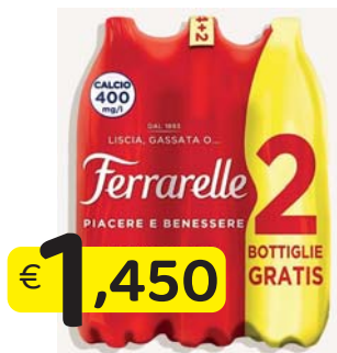
FERRARELLE ACQUA EFF. NATURAL 1,5 Lt. CONFEZIONE 4+2 OMAGGIO