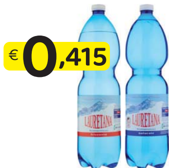
LAURETANA ACQUA NATURALE/ FRIZZANTE 1,5 Lt. PET