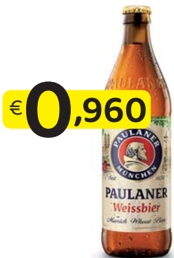
PAULANER HEFE-WEIZEN BOTTIGLIA 50 CI. VAP