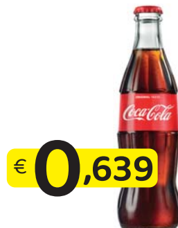
REGULAR 33 CI. VAP