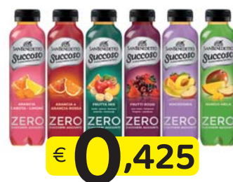
S. BENEDETTO SUCCOSO 40 CI. PET