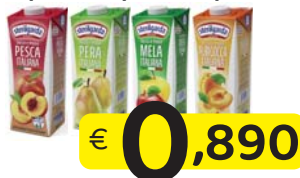
ACE/ANANAS/TROPICALE/ ARANCIA STERILGARDA SUCCHI 1 Lt.