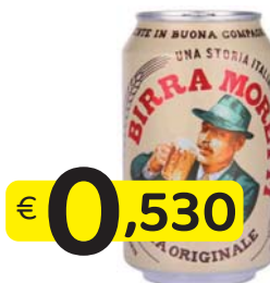
MORETTI BIRRA LATTINA 33 CI.