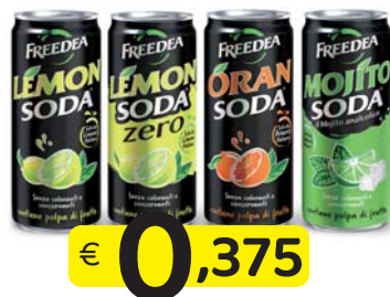
LEMONSODA/ORANSODA/ MOJITO/ LEMONSODA ZERO 33 CI LATTINA