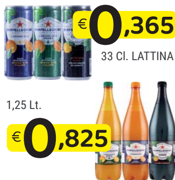
SAN PELLEGRINO CHINO'/ARANCIATA DOLCE/ ARANCIATA AMARA