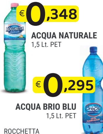
ACQUA BRIO BLU 1,5 Lt. PET ROCCHETTA