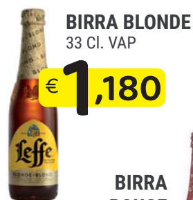
BIRRA BLONDE 33 CI. VAP LEFFE BIRRA ROUGE 33 CI. VAP €1,280