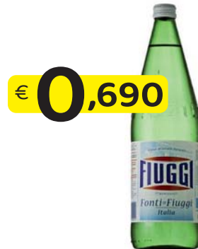
FIUGGI ACQUA NATURALE 1 Lt. VAP