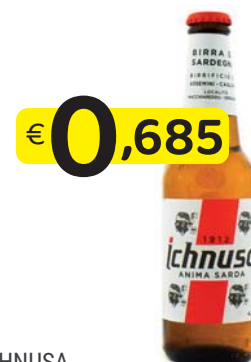
ICHNUSA BIRRA BOTTIGLIA 33 CI. VAP